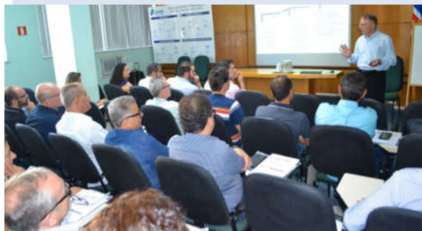
Capacitação sobre governança corporativa – novembro/2019