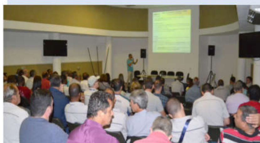
Capacitação sobre Código de Conduta Ética e Integridade – novembro/2019