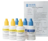
Reagentes para Cloro Livre 300 Testes HI93701-F